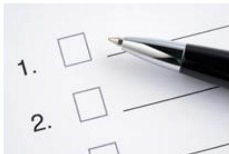
ターゲットリスト