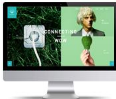
問い合わせフォーム検索